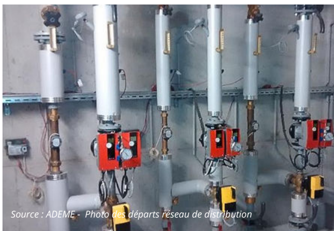
Photo des départs réseau de distribution