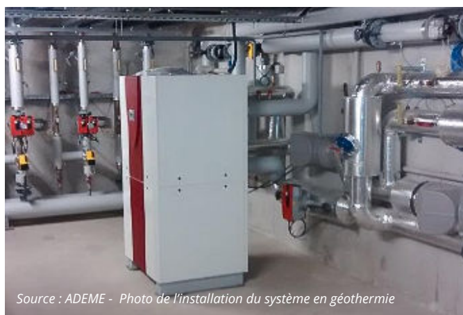
Photo de l'installation du système en géothermie